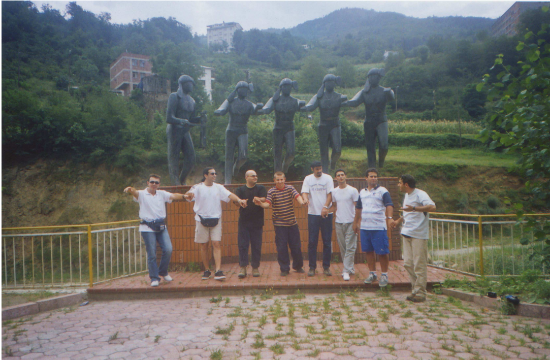
Έλληνες επισκέπτες χορεύουν «Σέρα» μιμούμενοι το μνημείο που βρίσκεται πίσω τους. Τσιβισλούχ – περιοχή Τραπεζούντας. (φωτ. Ποντιακός Σύλλογος Φιλύρου).