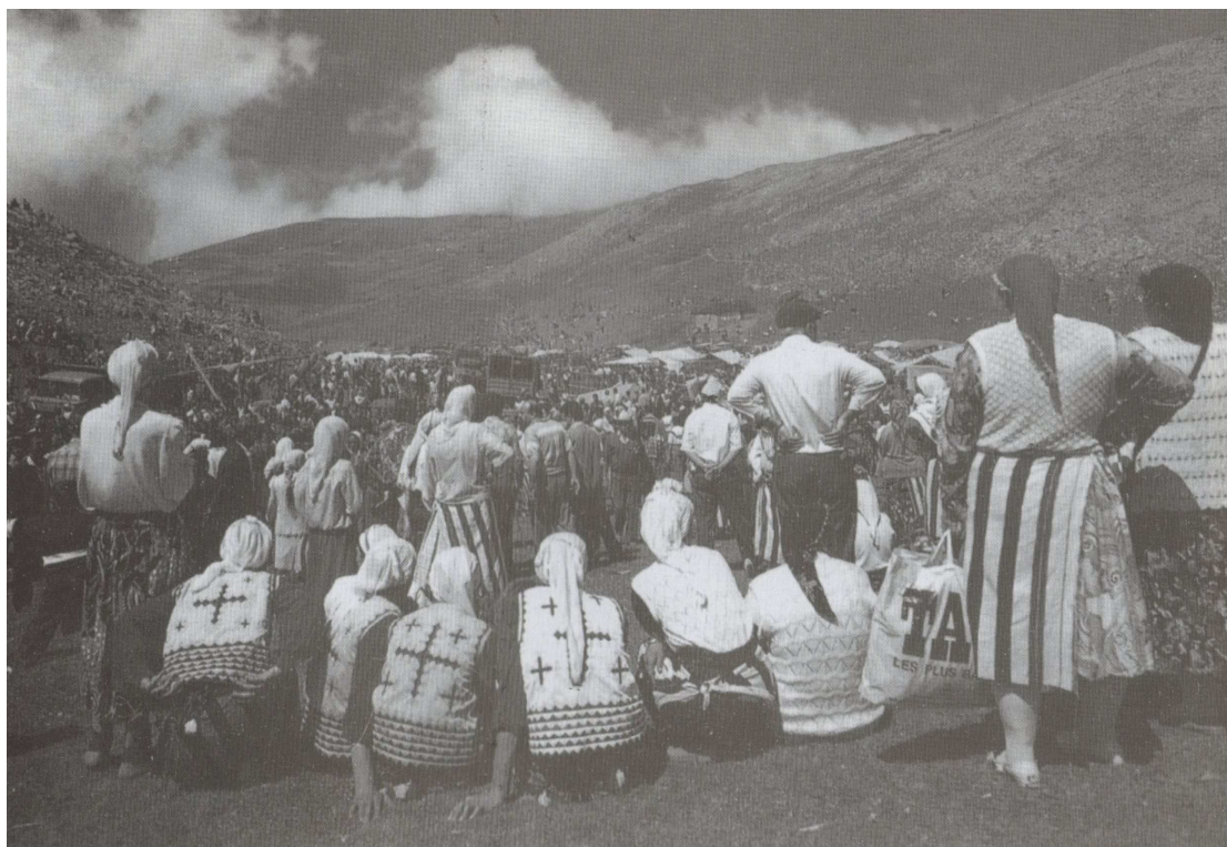
Κατάλοιπο της χριστιανικής τους πίστης, ο σταυρός που εμφανώς διακρίνεται. (Από εκδήλωση ελληνοφώνων στον Πόντο).