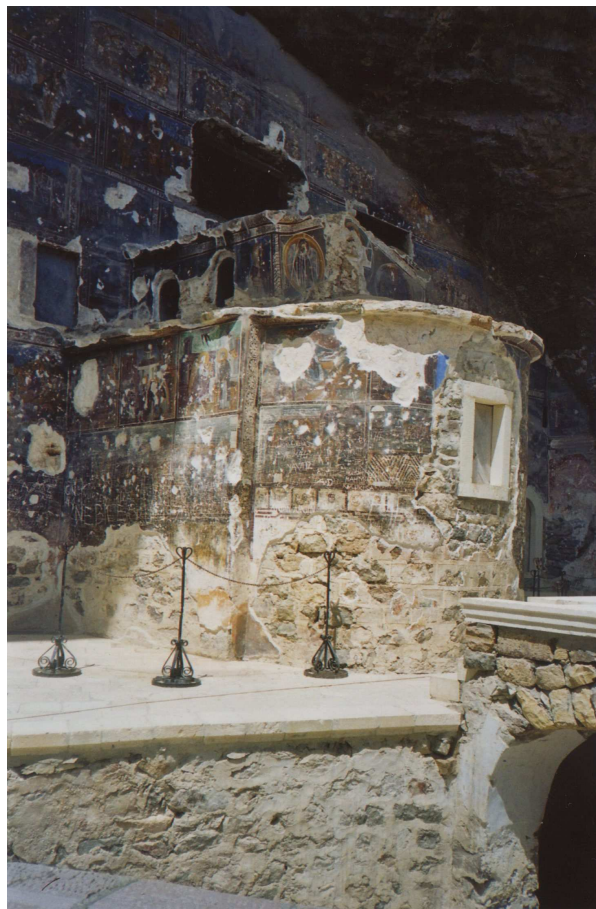
Το Ιερό της Μονής.