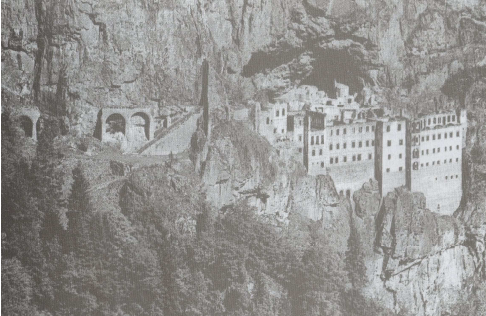
Ιερά Μονή Παναγίας Σουμελά.