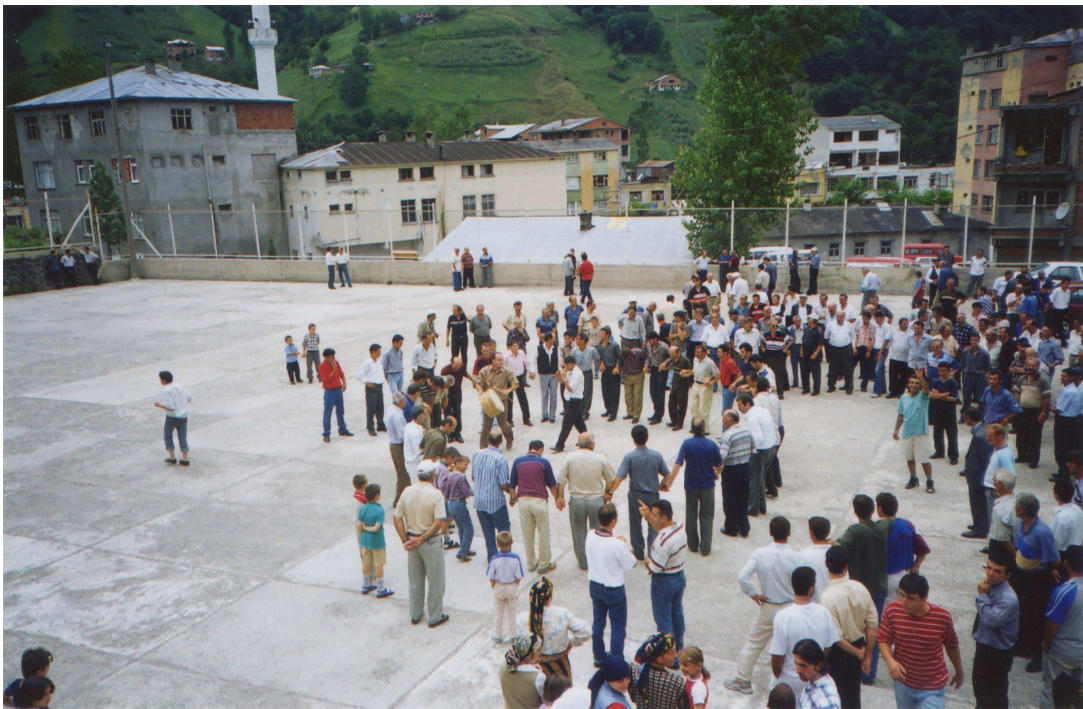
Ποντιακός γάμος στην Τόνια – Αύγουστος 2001.