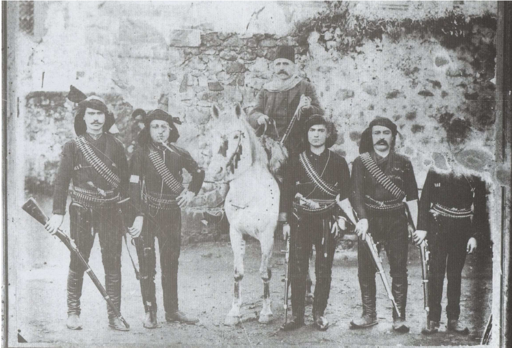
Ακ-ντάγ Μαντέν. Μέλη της κρυπτοχριστιανικής οικογένειας Κιουπτσίδα.