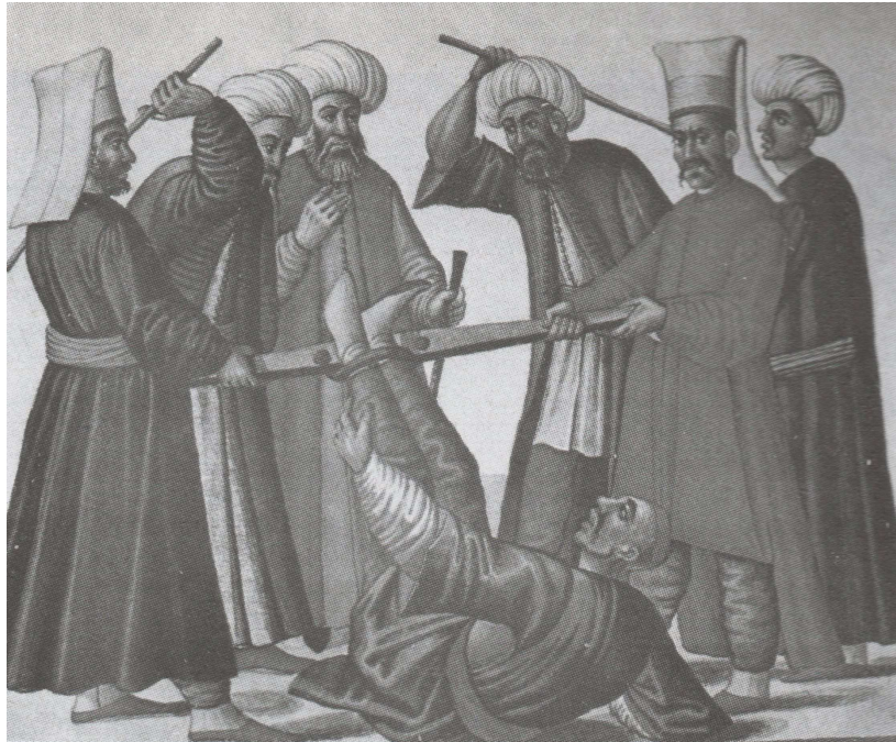
Ο βασανισμός ενός κρυπτοχριστιανού με φάλαγγα (Πίνακας από την Εθνική Βιβλιοθήκη της Βιέννης).