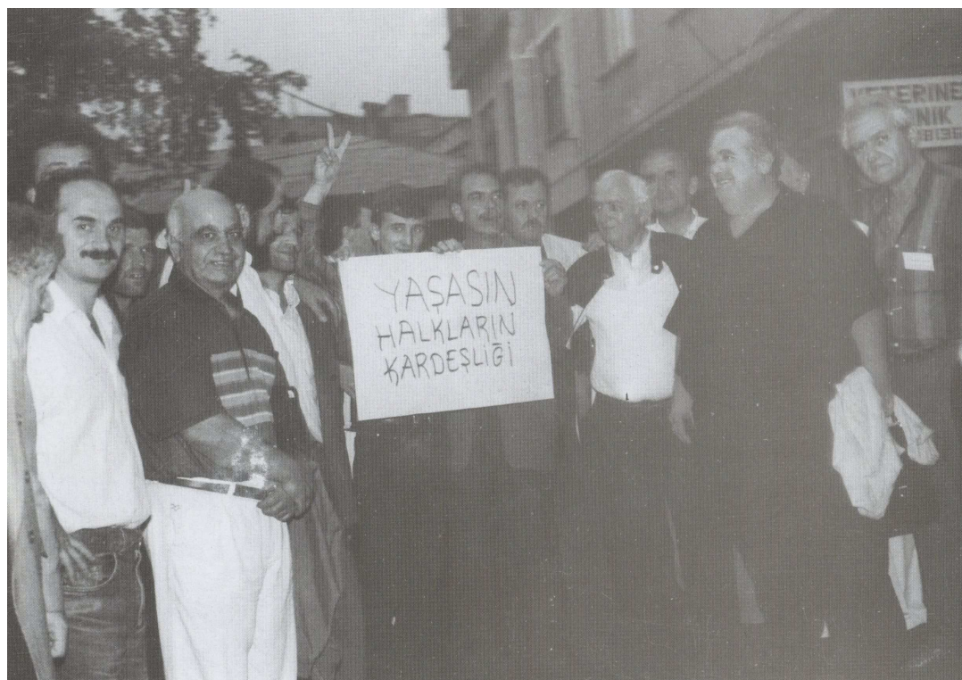
Εγκάρδια υποδοχή των Ελλήνων από τους ελληνόφωνους συμπατριώτες του Πόντου.