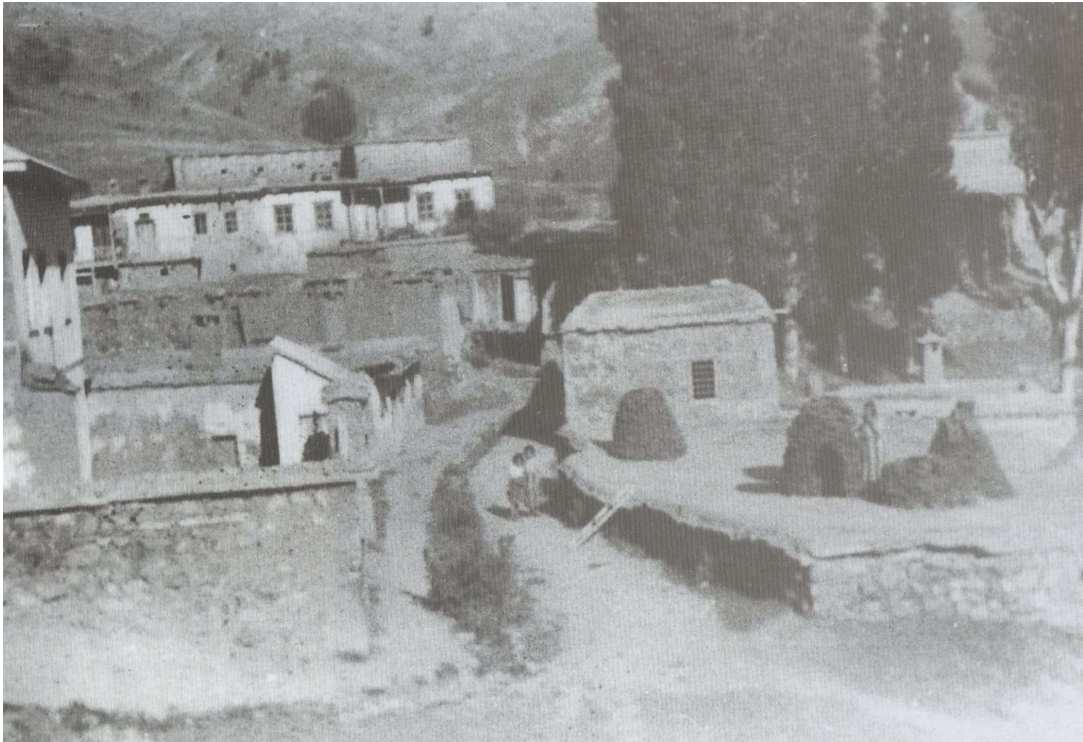
Το χωριό Σταυρί του Πόντου.